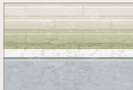
●カビやコケの発生