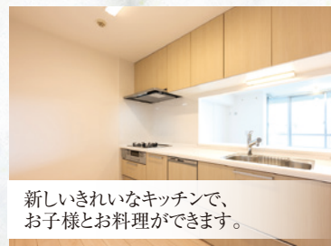
新しいきれいなキッチンで、 お子様とお料理ができます。