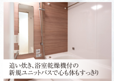
追い炊き、浴室乾燥機付の 新規ユニットバスで心も体もすっきり