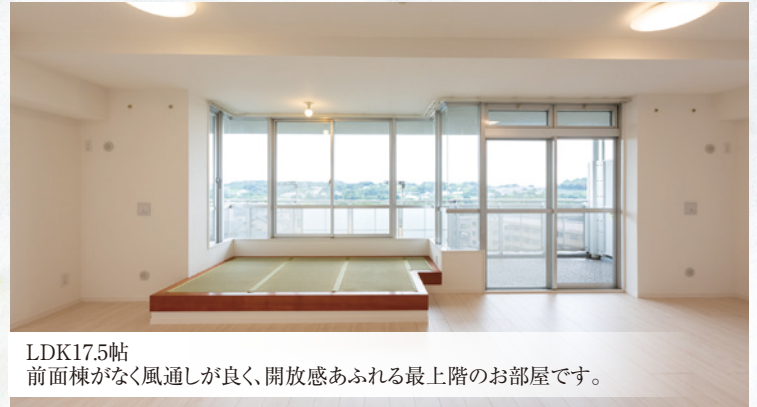
LDK17.5帖 前面棟がなく風通しが良く、開放感あふれる最上階のお部屋です。