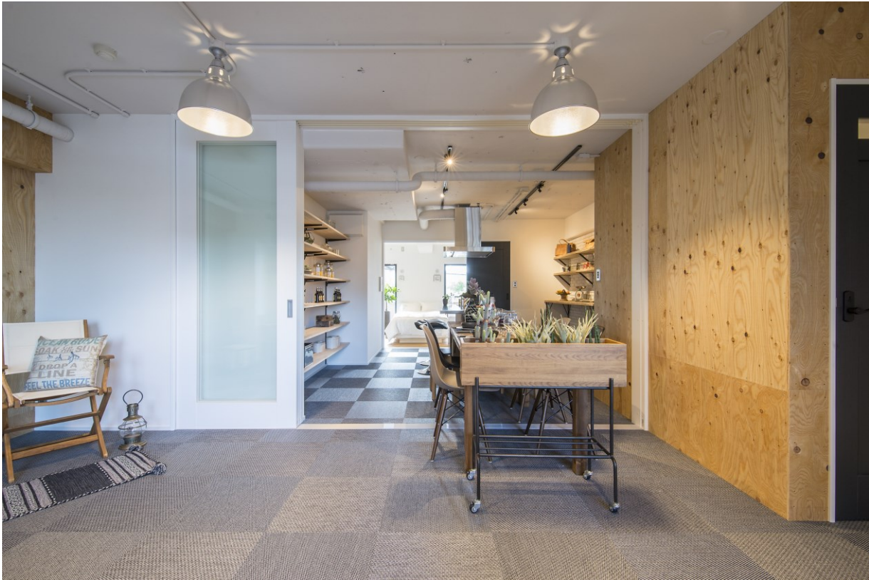
「あそぶ」をコンセプトにしたモデルルーム

株式会社小田急ハウジング（本社：東京都渋谷区 社長：菅原 康洋）および小田急不動産株式会社（本社：東京都渋谷区 社長：雪竹 正英）では、マンションリノベーションの提案強化策として、新商品「リノフィーノ」を12月1日（金）より発売し、第一弾として「あそぶ」をコンセプトにしたモデルルームを開設しましたので、お知らせいたします。